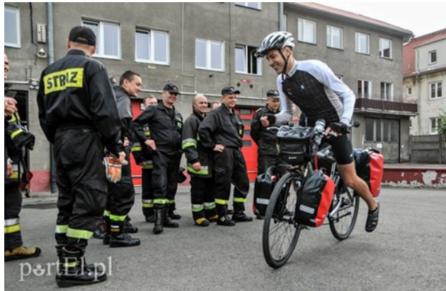
Rajd rowerowy, pn.: „Odlotowy Bibliotekarz”.

Strażacy z OSP Opatówek zabezpieczali Rajd rowerowy Opatówek - Murowaniec organizowany przez bibliotekę w Opatówku.