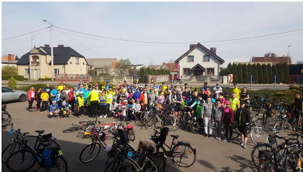
Rajd rowerowy z Przedszkolakiem