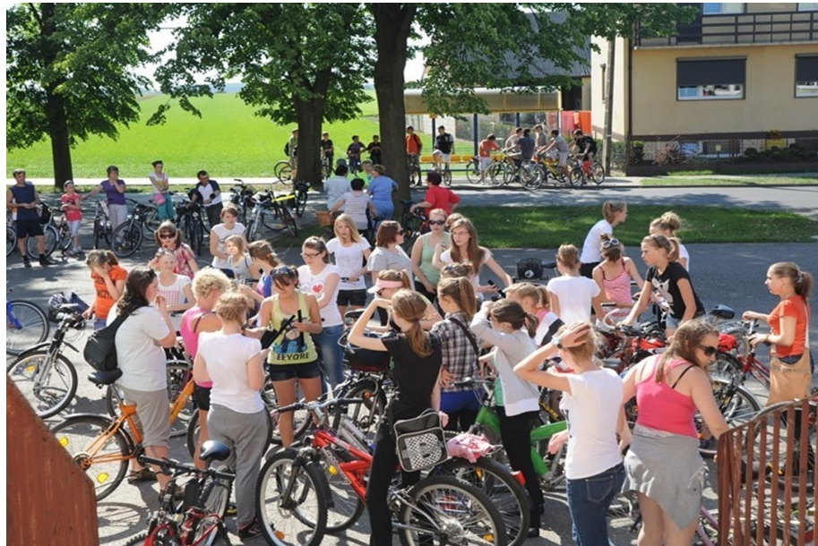
Gołuchowski Rajd Rowerowy - Święto Polskiej Niezapominajki.