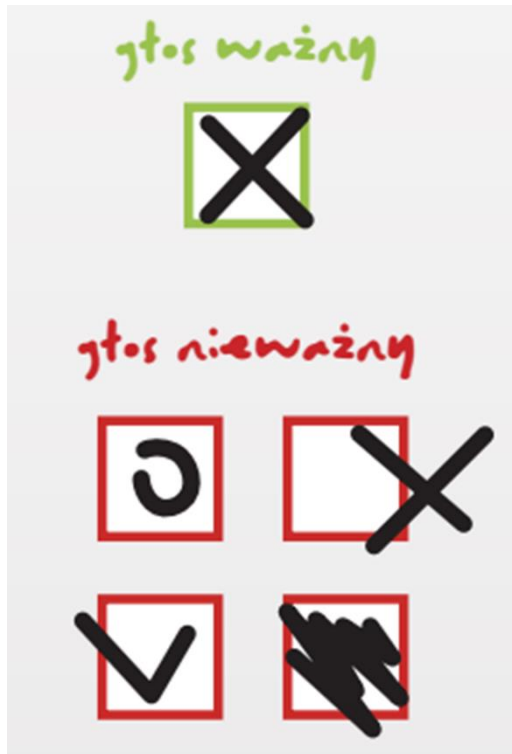
Rysunek 1. Jak głosować?

2. Weź dokument tożsamości. Aby wziąć udział w głosowaniu, musisz mieć przy sobie ważny dowód osobisty lub paszport.